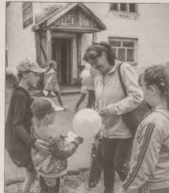
■ Стихи в кармашек для больших и маленьких

Люди встречали необычное шествие с удивлением, любопытством и улыбками. Участники флешмоба были очень активны и сами получили огромный заряд бодрости от этой акции. А мы, организаторы, были довольны тем, что 300 стихов «ушло в народ». Мы очень надеемся, что многие наши односельчане не только вспомнили