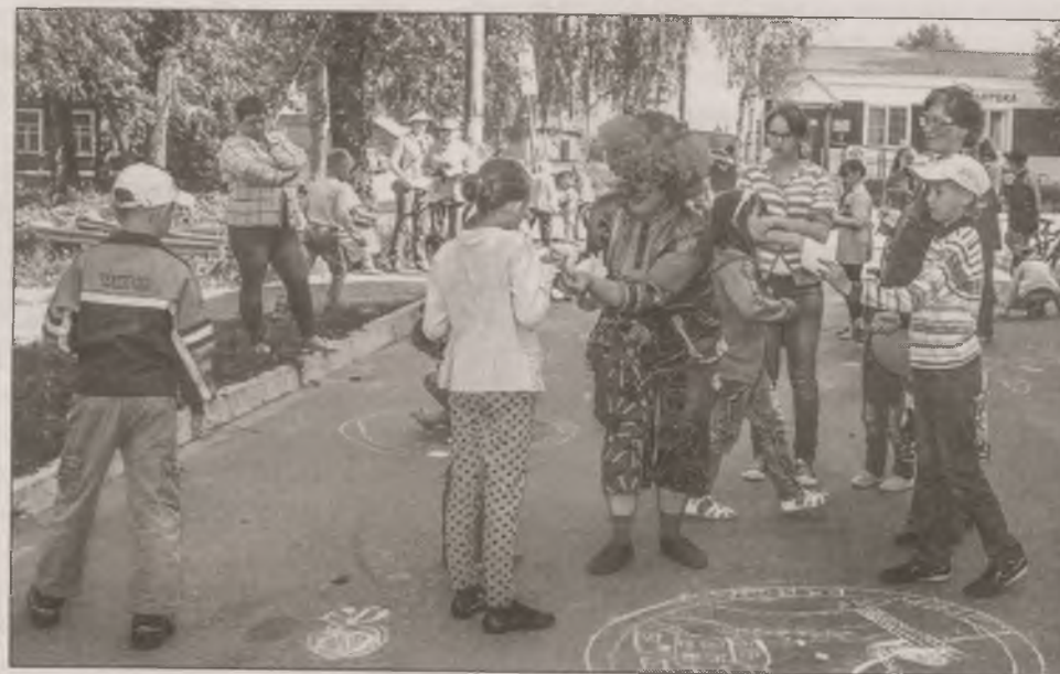
■ Рисунки на асфальте раскрыли таланты многих начинающих художников

Другая уличная акция, также состоявшаяся в прошлом году, была посвящена юбилеям республики и Койгородка. Она прошла под названием « Я рисую на асфальте ». В День защиты детей весёлый клоун Митрошка раздавал родителям с детьми разноцветные мелки. И ребята должны были постараться нарисовать герб своей республики или изобразить любимый уголок родного села. Конечно, ребята — да что там, даже мамы и папы — включились в это занятие с большим увлечением. Загадки, шутки,