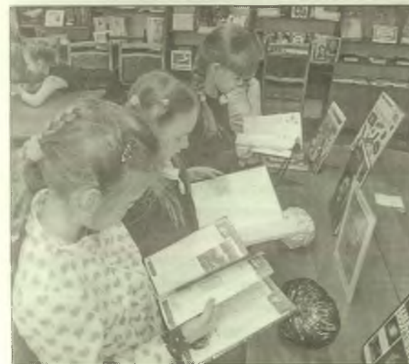
■ О межзвездных перелётах школьники узнали, просмотрев книжки, подготовленных к беседе-путешествию «Космонавтом быть хочу!»

Юные читатели приняли участие в мастер-классе по изготовлению игрушек из бума-