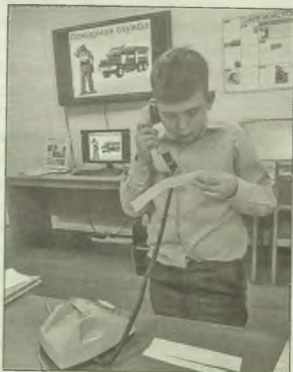
■ Как нужно действовать при пожаре? Конечно, позвонить по телефону «01»!

Во время часа мужества «Есть такая профессия — Родину защищать», на котором рассказы-