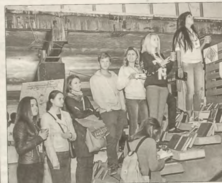
■ «Лестница познания», ставшая частью мероприятия для молодёжи «Лофт. Калининград»

Ровно на одну неделю Дом Советов стал центром общения. В стенах заброшенного здания заиграла жизнь — мы создали библиотечный уголок «Лестница познания» для уединения с книгой, а также провели целую серию интеллектуальных игр для привлечения внимания к чтению и нестандартному анализу произведений мировой литературы. В общей сложности эти мероприятия посетило 200 человек.