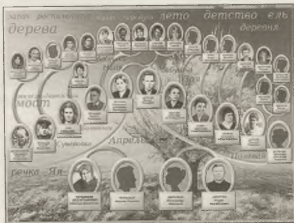
■ Одна из работ проекта «Книга с фамилией» — генеалогическое древо

За два последних года было разработано четыре форум-спектакля по произведениям А.П. Чехова, которые уже более 20 раз представили публике и вовлекли её в драматическое действие. Суть этой технологии в том, чтобы вызывать у зрителя эмоциональный отклик. Именно поэтому невозможно сыграть два абсолютно одинаковых спектакля. Каждый раз это новое действие. И таким его делает зритель!