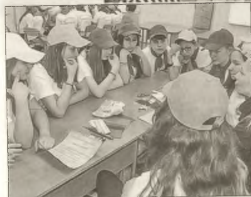
■ Проект «Ищайк@»