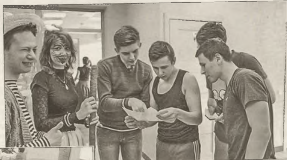
■ Идёт подготовка к «Литературному дозору»

К сегодняшнему дню коллеги разработали уже пять детективов. Некоторые из них были успешно представлены на открытых площадках и в качестве мастер-классов на образовательных форумах и конференциях.