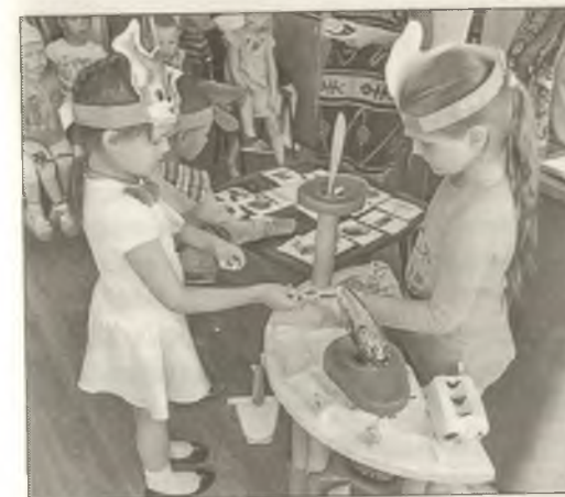
■ Программа по финансовому просвещению. Игры для детей