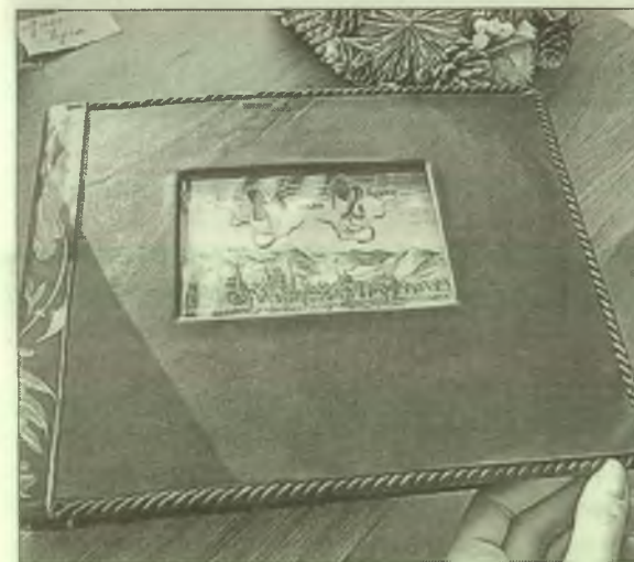
■ Такую роскошную «одежду» получили издания на занятиях проекта «Ручная книга»

Но самое главное то, что программа рассчитана на семейное участие — очень многие посещали занятия вместе с родственниками. Его результатом стало создание фотовыставки «История семьи — история страны», информационно-биографических листовок и генеалогических древ. На данный момент этот проект также вышел на самостоятельный этап реализации.